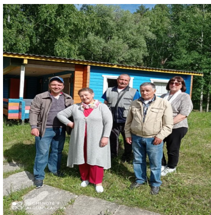
члены ВОИ трех районов

трех районов Седельниковского, Большереченского и Исилькульского. Время провели великолепно: поиграли, попели песни, потанцевали, посмотрели сценку, которую подготовили для нас члены