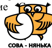
СОВА - НЯНЯКА

Специалисты центра уверены, что на новом оборудовании маленькие непоседы смогут не только поиграть, но и с пользой провести время в уютном доме - няньки.